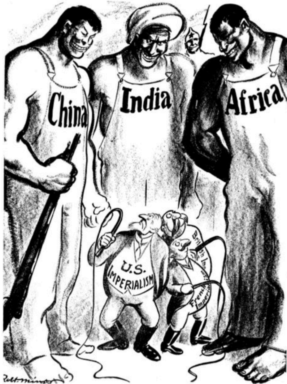
Figure 6. Robert Minor, "On the International Slave Plantation." Daily Worker , June 27, 1925. Caption: Who Is That You All Are Going to Whip, Mr. Legree?