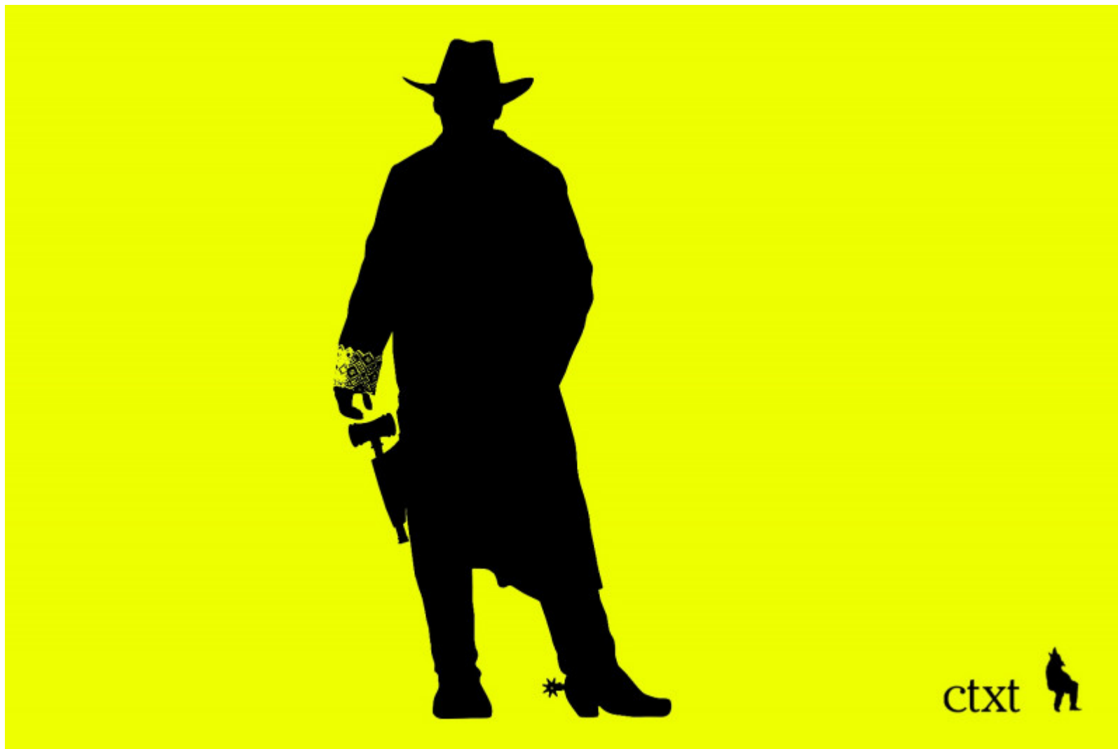
Lawfare Corral. / La Boca del Logo

En CTXT podemos mantener nuestra radical independencia gracias a que las suscripciones suponen el 70% de los ingresos. No aceptamos “noticias” patrocinadas y apenas tenemos publicidad. Si puedes apoyarnos desde 3 euros mensuales, suscríbete aquí