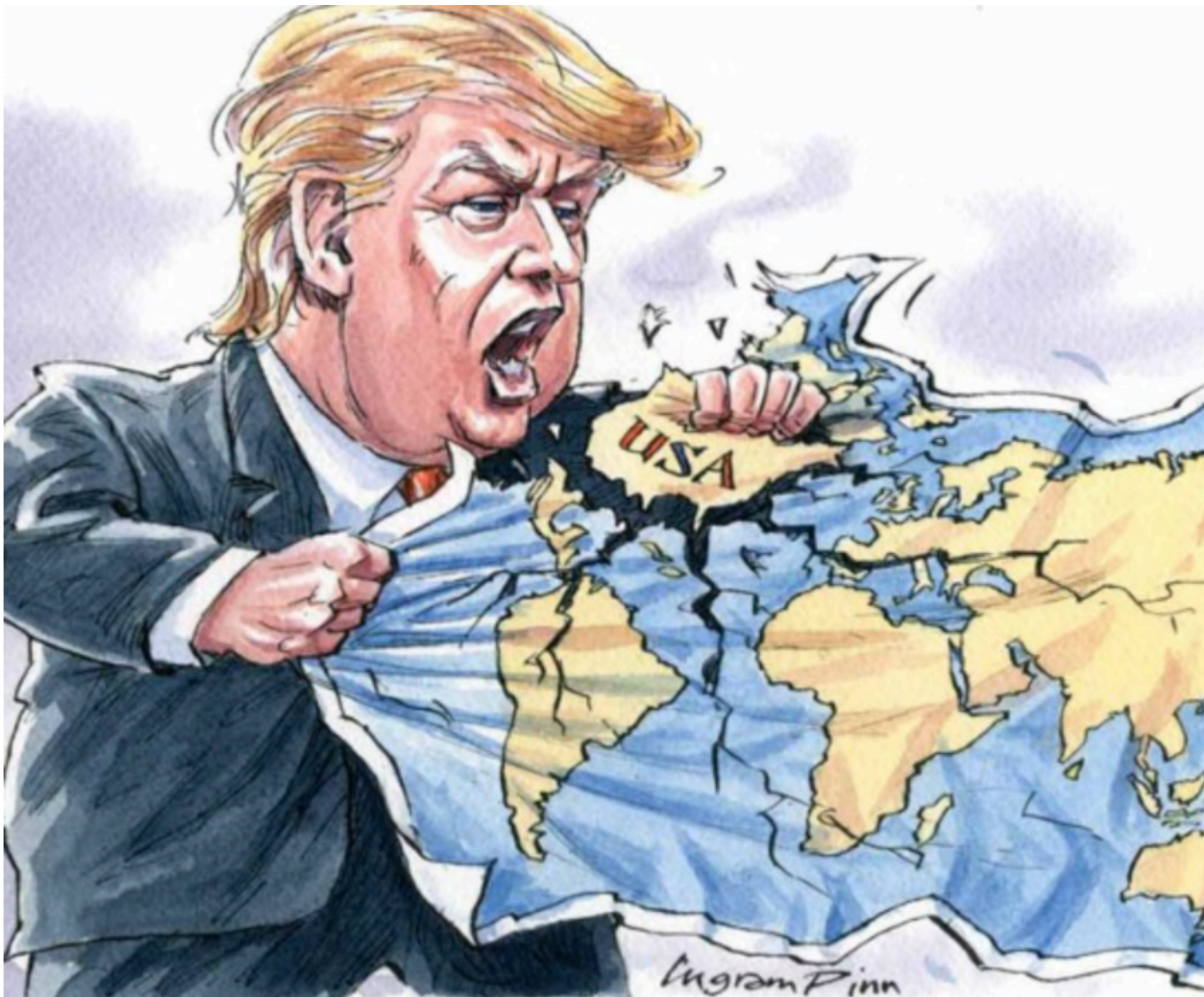
La destrucción por Trump de la economía estadounidense