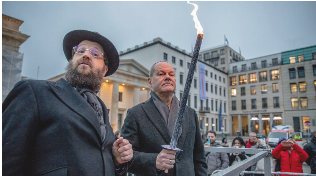
El canciller alemán Olaf Scholz en un acto reciente en Berlín