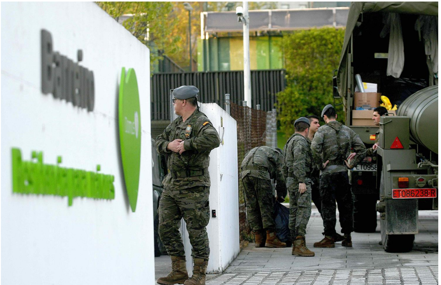
Militares entrando na residencia DomusVi de Barreiro (Vigo).

Dúas residencias de DomusVi intervidas pola Xunta con recursos públicos durante a pandemia do coronavirus. Descoñecemento do número de falecementos. Familias indignadas que acabarán levando aos tribunais á empresa. Conexións persoais e políticas detrás dun negocio millonario a base de recortes, contratos que absorben pensións e recursos familiares, salarios moi baixos e unha defensa pechada desde as autoridades.