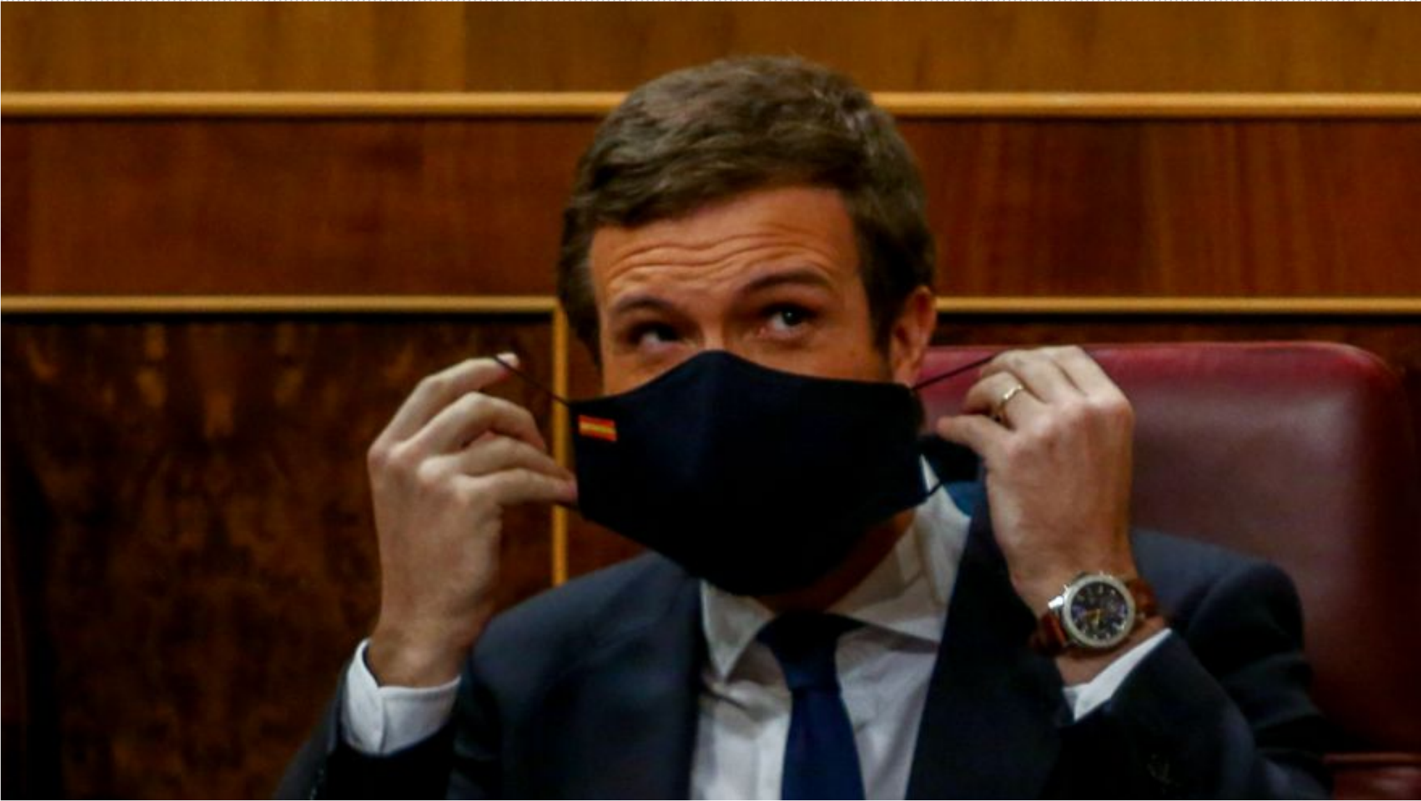
El líder del PP, Pablo Casado, durante una sesión plenaria en el Congreso