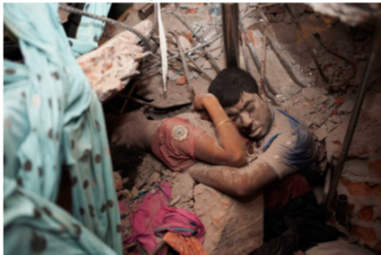
Figure I.1 Rana Plaza

La tragedia de Rana Plaza de 2013, cuando una enorme fábrica de ropa en Bangladesh se derrumbó, piso tras piso, aplastando a muchos de sus ocupantes fue un momento catárquico. "El desastre de Rana Plaza resultó ser un monumento al fracaso total y absoluto del activismo occidental: 1.134 trabajadores perecieron". Los boicots de consumidores y las campañas en el norte global contra los 'talleres de explotación' demostraron no haber servido para nada.