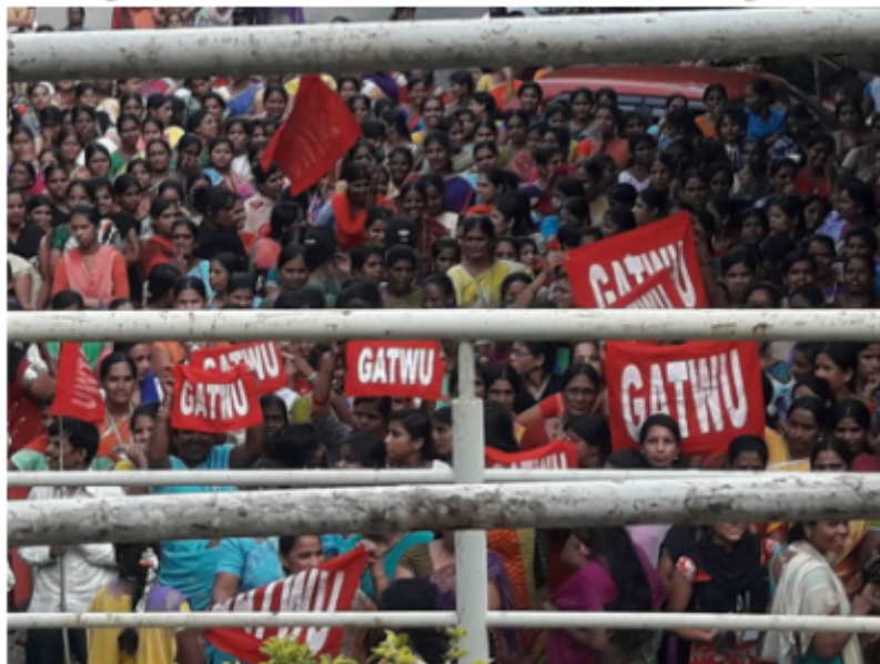
Figure 4.1 Garment workers on wildcat strike, 2016, Bangalore

En estos estudios de caso, Kumar revela que ha habido una mayor consolidación de los proveedores, aumentando la parte del valor de los proveedores sobrevivientes y, por lo tanto, facilitando la autoinversión y mayores barreras de entrada. Las luchas de los trabajadores por los salarios y las condiciones han alterado el equilibrio del poder económico entre las multinacionales y los proveedores nacionales.