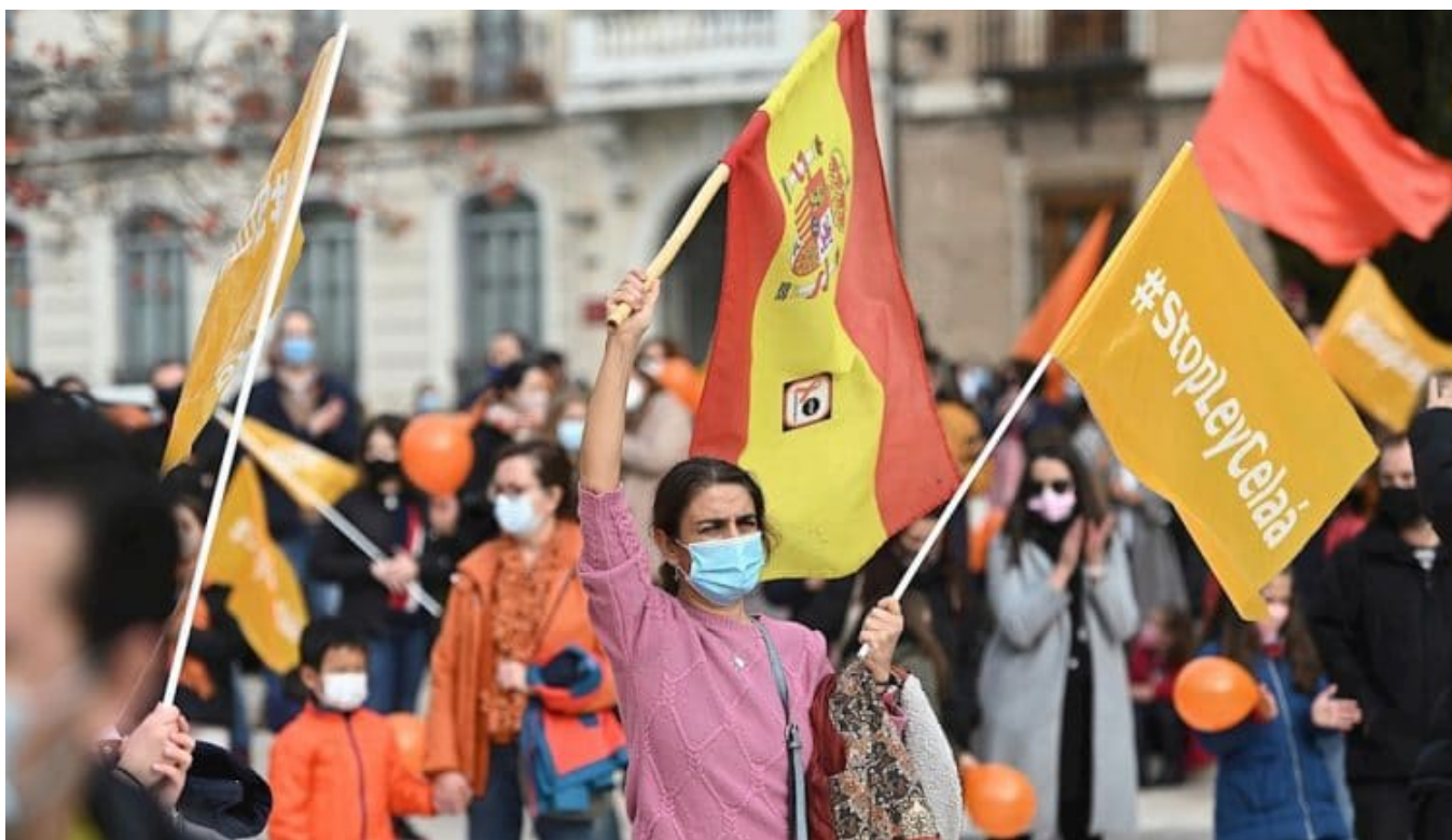
Manifestación de los colegios concertados de Alcalá (Madrid) contra la LOMLOE o Ley Celaá el pasado 19 de noviembre.

Por Guillermo Silva Uribarri, Carlos Fernández Liria y Silvia Casado Arenas