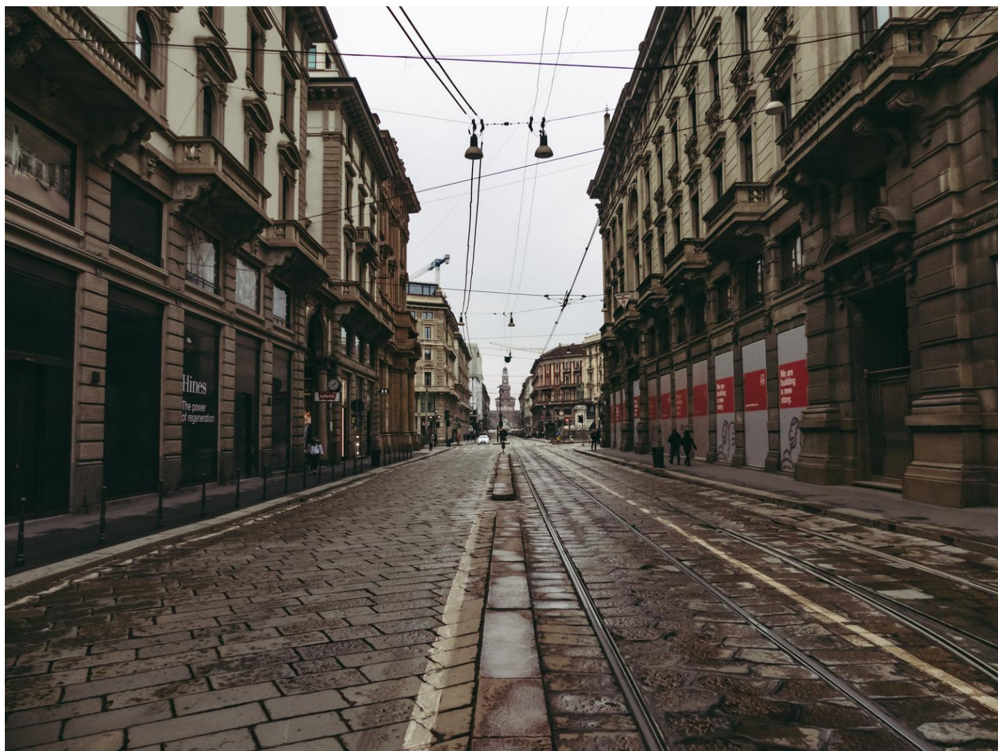
Las calles de Milán, vacías por las crisis del coronavirus.

Resulta realmente increíble que las clases políticas del sur de Europa no sepan que con independencia de lo que puedan extraer, ello siempre caerá, parafraseando a Draghi, bajo la siguiente aseveración: “Créanme, no será suficiente”.