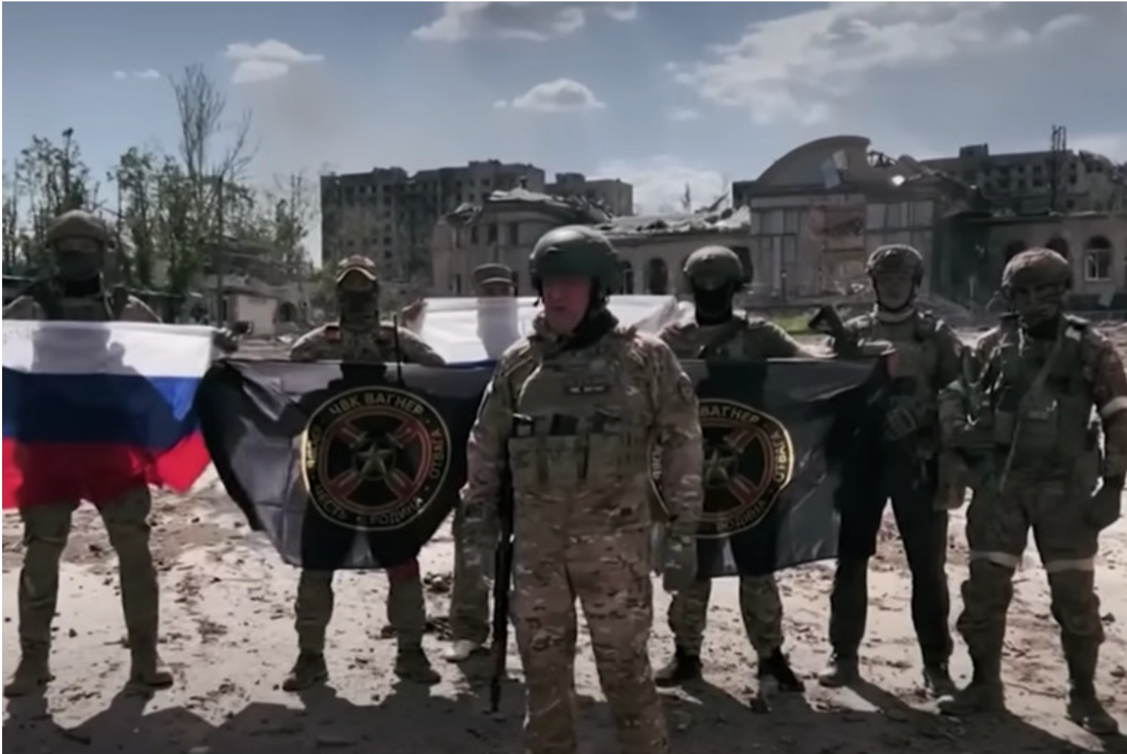
Yevgueni Prigozhin, junto a otros militares del grupo de mercenarios Wagner, en la ciudad de Rostov el pasado 24 de junio. / CNN

A diferencia de otros medios, en CTXT mantenemos todos nuestros artículos en abierto. Nuestra apuesta es recuperar el espíritu de la prensa independiente: ser un servicio público. Si puedes permitirte pagar 4 euros al mes, apoya a CTXT. ¡Suscríbete!