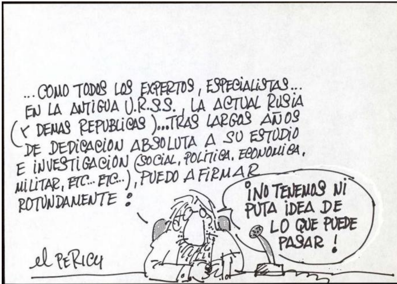
Viñeta del ilustrador Jaume Perich Escala.

La verbena de Prigozhin no es el único escenario inaudito que se podía esperar en Rusia. Como he explicado en otro lugar , uno de los dramas de la autocracia es que, por falta física de espacio de protesta, así como de posibilidades electorales de relevo y alternancia, crea oposiciones condenadas a practicar el derribo total de una estructura apenas reformable. En Rusia la oposición está condenada a ser inoperante, porque nunca ha tenido responsabilidades de