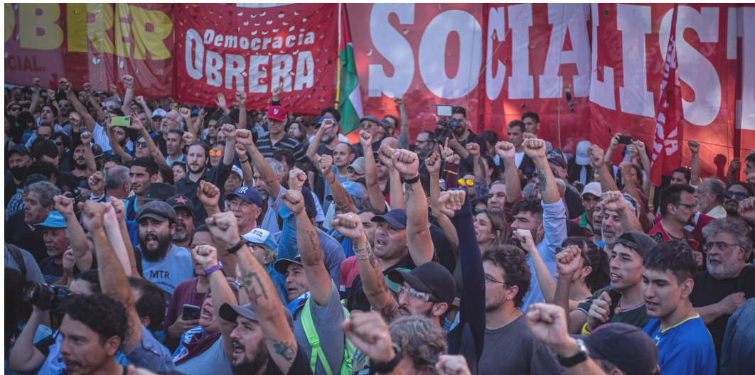
Movilización en Argentina contra el gobierno de Javier Milei