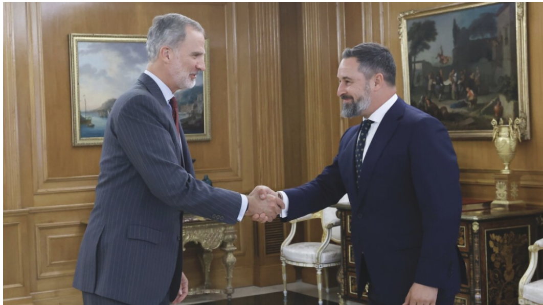
Felipe VI estrechando la mano de Santiago Abascal