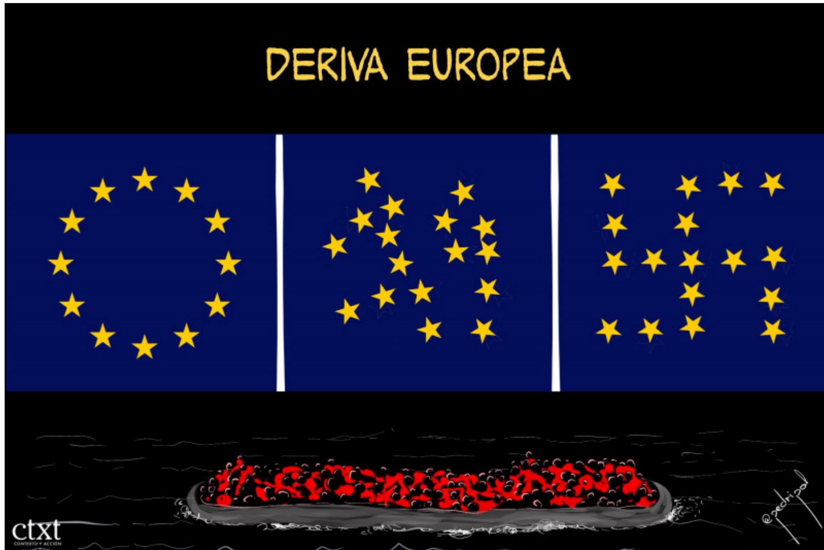
UE: Ultraderechización Europea. / Pedripol

En CTXT podemos mantener nuestra radical independendia gracias a que las suscripciones suponen el 70% de los ingresos. No aceptamos "noticias"