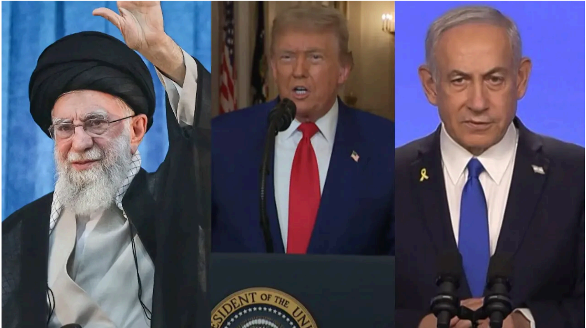
El ayatolá Alí Khamenei, Donald Trump y Benjamin Netanyahu - YouTube