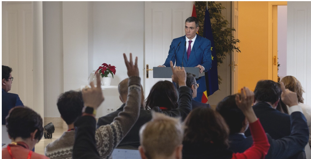
Pedro Sánchez en la rueda de prensa en Moncloa el pasado 26 de diciembre