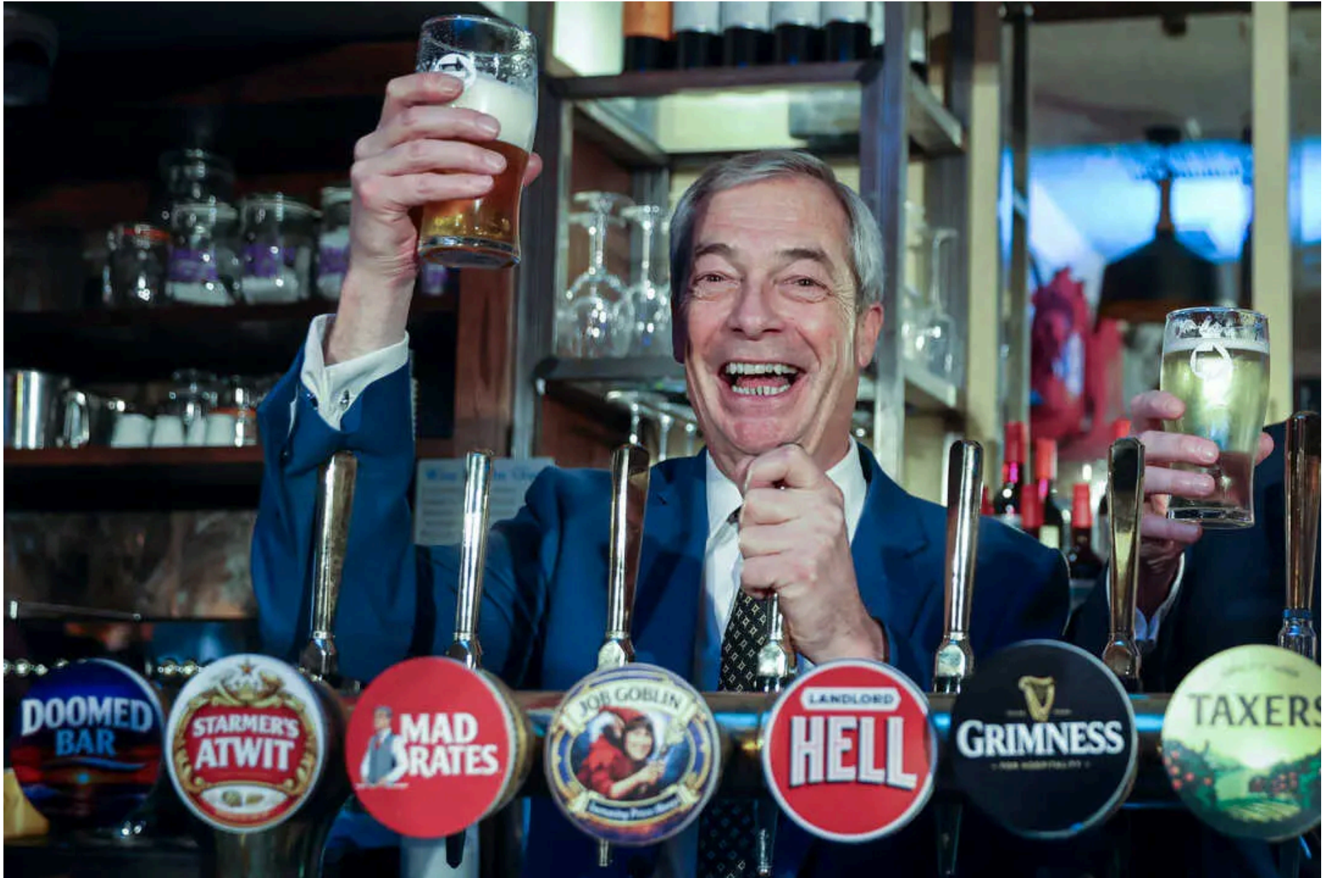
El líder de Reform UK Nigel Farage