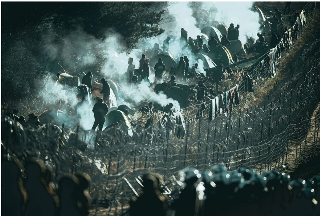
Cientos de migrantes acampan en el lado bielorruso de la frontera con Polonia, en esta fotografía publicada por el Ministerio de Defensa polaco el 10 de noviembre

A su vez hemos tenido una nueva ronda de tensiones alrededor de Ucrania, similar a la de abril de 2021, con alrededor de 150 mil tropas rusas amasadas en la frontera, en Crimea y