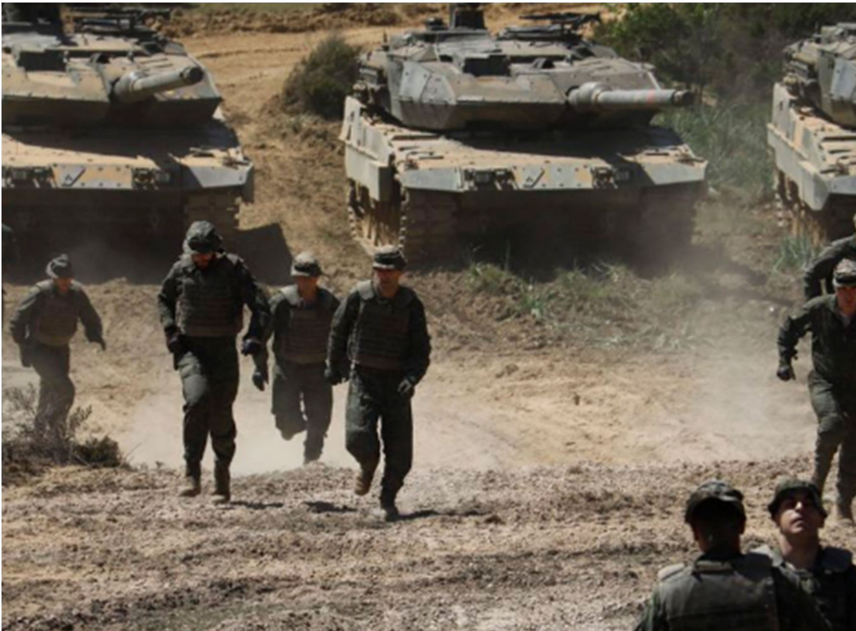
El coste humano de la guerra