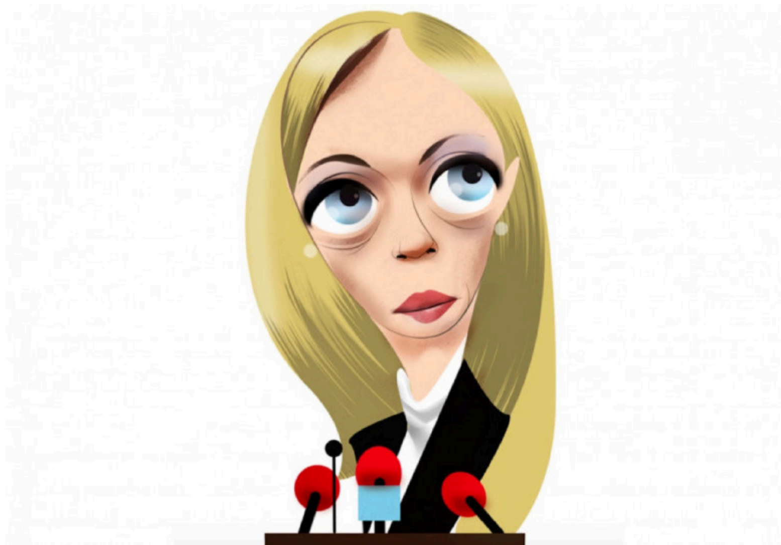
Giorgia Meloni. / Luis Grañena

En CTXT podemos mantener nuestra radical independencia gracias a que las suscripciones suponen el 70% de los ingresos. No aceptamos “noticias” patrocinadas y apenas tenemos publicidad. Si puedes apoyarnos desde 3 euros mensuales, suscribete aquí