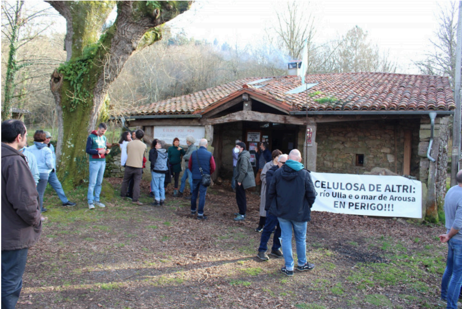
Reunión de la plataforma Ulloa Viva.

En CTXT podemos mantener nuestra radical independencia gracias a que las suscripciones suponen el 70% de los ingresos. No aceptamos "noticias"