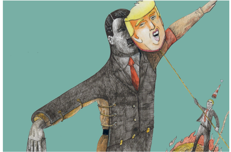
(Ilustraciones: El Gordo)