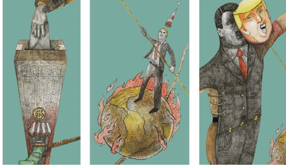
Ilustraciones: El Gordo

hablar todavía de un nuevo bloque histórico, en el sentido gramsciano del término. Es más una convergencia basada en intereses comunes que la constitución de un bloque.