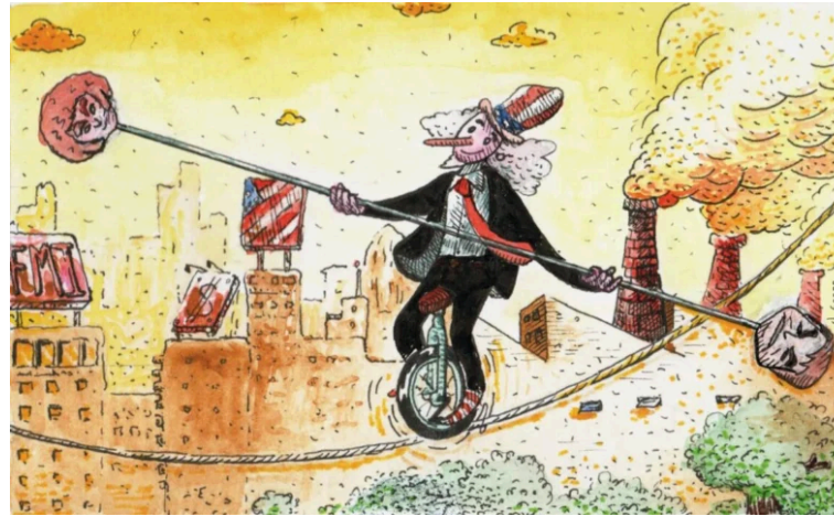
Ilustraciones: El Gordo

potencias, como el de Alemania tras la Primera Guerra Mundial. ¿Te parece una conexión que se puede establecer también en el presente? Es decir, lo que estamos viendo hoy, con el ascenso de las nuevas extremas derechas, ¿puede estar relacionado con un proceso más amplio de declive de Occidente frente al ascenso de Asia, y especialmente de China? ¿Pensás que esa disputa geopolítica es una motivación importante — aunque quizás indirecta — del auge de estas derechas?