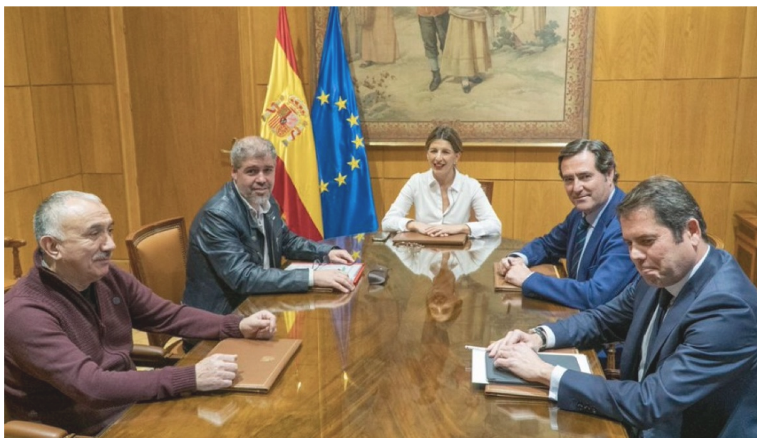
Reunión de la ministra Yolanda Díaz con sindicatos y patronal — Ministerio de Trabajo